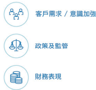
圖2：可持續投資推動因素

圖2資料來自安聯投資，2022年11月。ESG：環境、社會及管治。分類法：歐盟法規2020/852（分類法）；SFDR：歐盟可持續財務披露法規；MiFID II：金融工具市場監管和金融工具市場指令，統稱為「MiFID II」；CSRD：企業可持續發展報告指令。