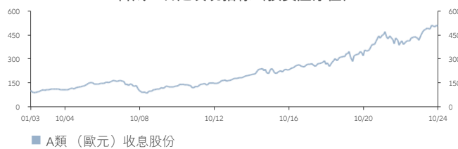
■ A類 (歐元) 收息股份